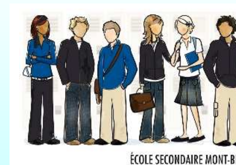
ÉCOLE SECONDAIRE MONT-BLEU

Vous devez vous procurer ces vêtements (haut seulement) auprès de Maison Piacente, Village Place-Cartier, 425, boul. St-Joseph, Gatineau, 1-800-361-1240